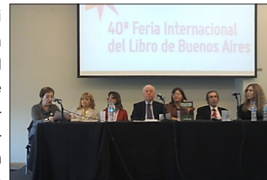
La directora del Área expone en la Feria del Libro.