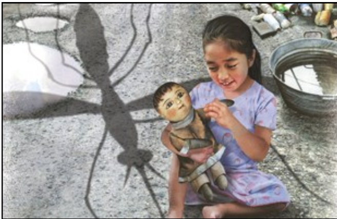
Afiche de la Organización Mundial de la Salud para el Día de la Salud 2014, dedicado a las enfermedades transmitidas por vectores.

El 7 de abril de 1948 se creó la Organización Mundial de la Salud (OMS) y para recordarlo, se instituyó esa fecha como Día Mundial de la Salud. Este año, estará dedicado a las enfermedades transmitidas por vectores como por ejemplo, mosquitos, moscas, garrapatas, etc. Son las enfermedades