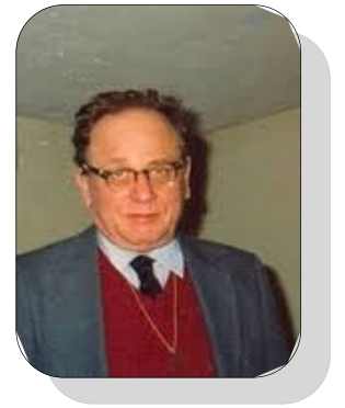
David Paul Ausubel (1918–2008)

Al hablar de aprendizaje significativo, Ausubel también estaba proponiendo una nueva relación entre maestros y alumnos, que estuviera basada en las necesidades y posibilidades de los aprendices. Una relación en la que el alumno no fuera visto como alguien vacío de conocimientos, a quien un erudito debería desarrollar. Otros la llamaron enseñanza centrada en el alumno y constituye el fundamento de muchas de nuestras ideas actuales sobre la relación maestro-alumno en el proceso de aprendizaje que construyen entre ambos.