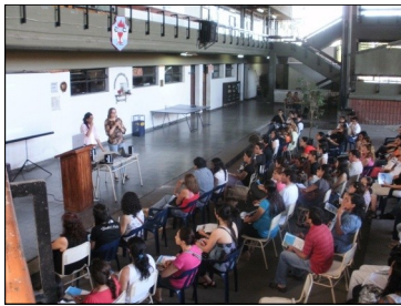
Las Prof. Martín y Orse, alumnas de la U.CAECE, informan sobre su experiencia a un grupo de postulantes.