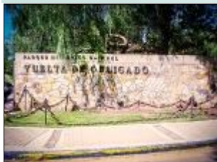
20 de noviembre de 1845 Batalla de la Vuelta de Obligado