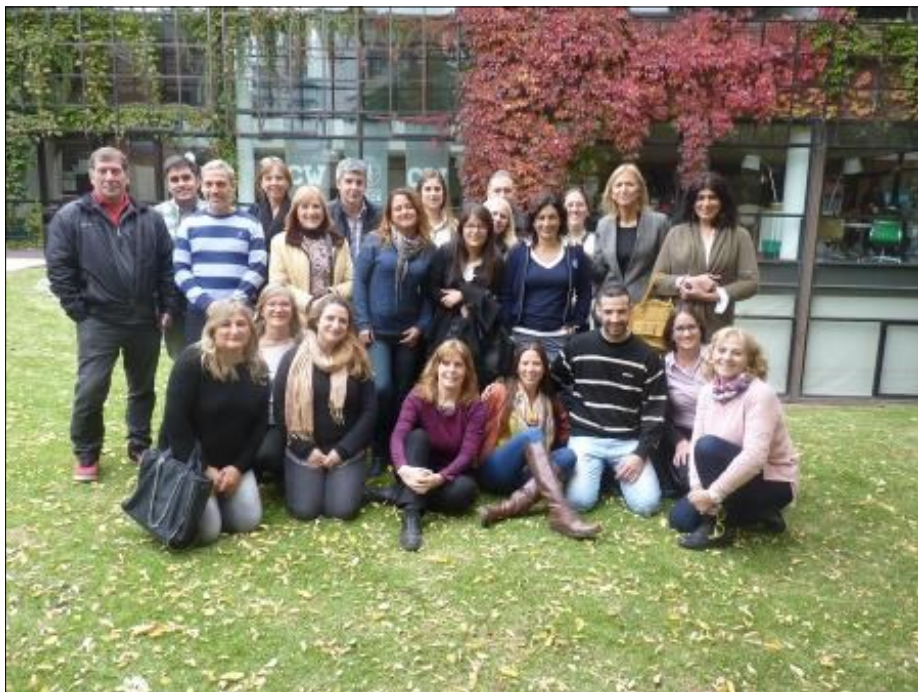
Mar del Plata, sábado 7 de mayo. Nuestra hermosa comunidad de aprendizaje.